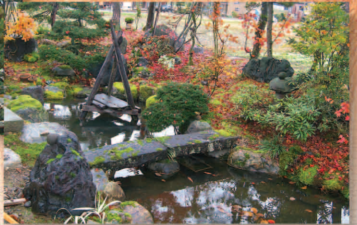
縁側から見た庭園

地元船山と八海山の雪の中で育まれた「魚沼産杉」「越後杉」をふだんに使い、魚沼の風土に合った和風住宅が完成しました。